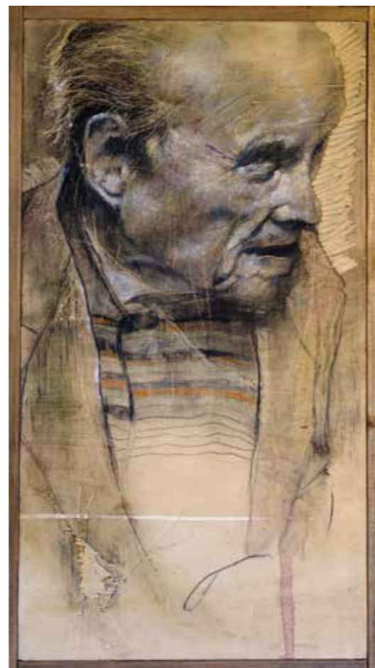
Dalla serie I From the series Disturbate divinità 2010 Olio, grafite e pastelli su tavola | Oil, graphite and pastel on canvas cm. 40x15

Finding an artist who, like Pierantonio Tanzola, knows how to smile at the seriousness of those who take themselves too seriously while they are straddling individualism (or even worse, exhibitionism, or the market) is so rare; rarer still is finding someone who knows how to offer himself "humbly" as an artist and also play the role of musician, photographer, reader and critic,