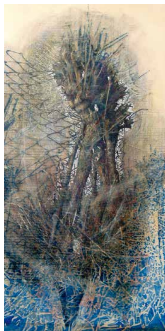
Apparizione del ceppo 2005 Olio, grafite e pastelli su tavola | Oil, graphite and pastel on canvas cm. 75x150