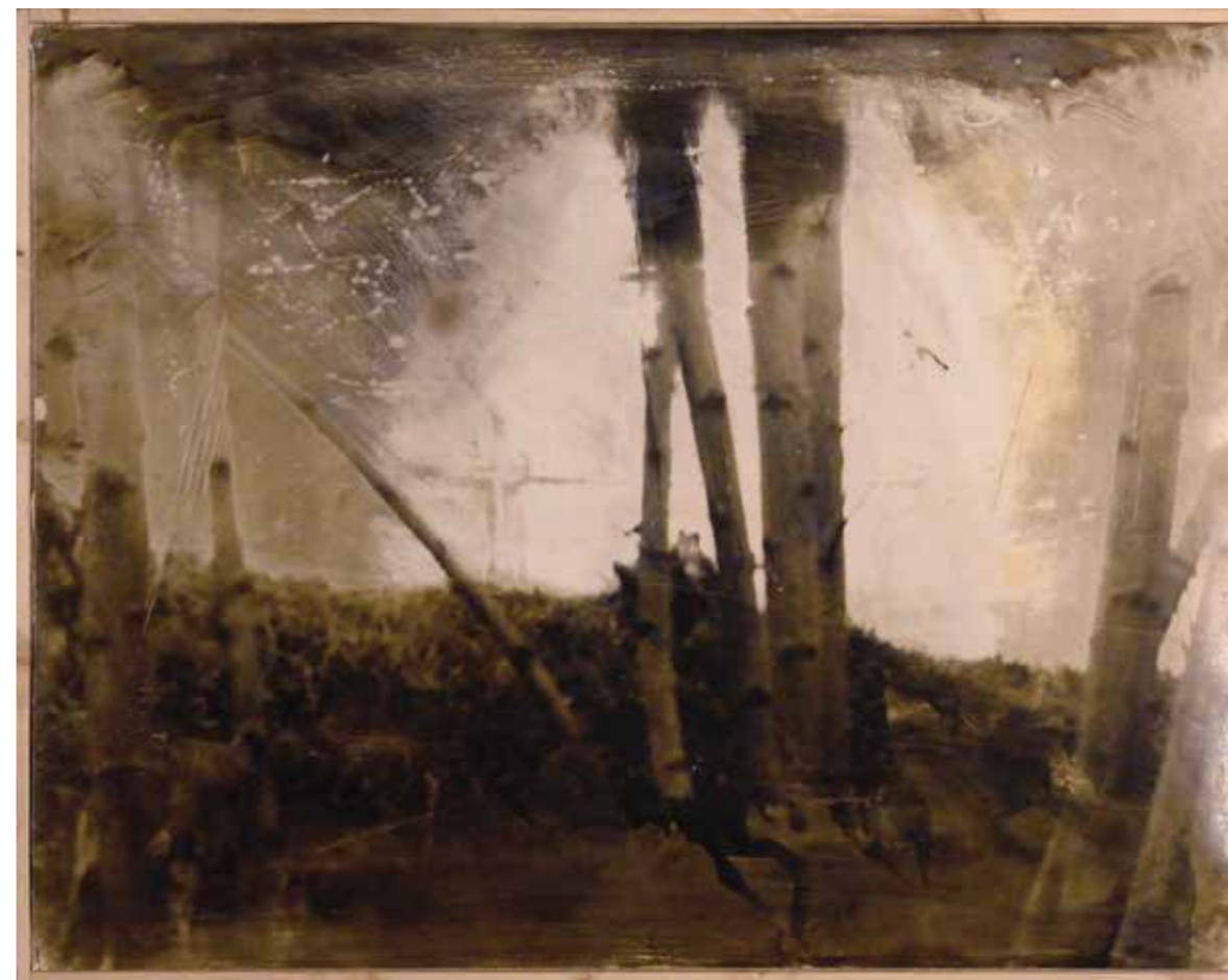
Dalla serie I From the series Omissis 2006 Foto b'n virata e solarizzata | Toned b'n photograph cm. 60x80

putting back into play that classicism that entails the skill of a fully finished homo faber or inestimable maker, forcing us to revolutionize the parameters we use to label and catalogue the world. This work of subtraction of the ego, that this artist practices with success, recalls the coveted search for the haecceity of philosophers and poets. Pierantonio Tanzola aspires exactly towards some of his works: become only a means through which nature portrays itself and puts its otherness into play. Here we can draw on the words of the philosopher Thomas Nagel who, when studying the gradual shift from a personal view of the reality of the world to an increasingly objective (and not human) perception, arrived at the conviction that the final aim of this process is the consideration of the world as an entity without a centre and the observer only as one of its possible contents. (Thomas Nagel, Mortal Questions , Cambridge: Cambridge University Press, 1979, p. 206). The metaphor is clear. Let us imagine for a moment that humanity has lost, or never had the ability to perceive in accordance with the absolutes we have got used to: what would we say if its interpretation/representation of reality had always been a fallacious parameter?