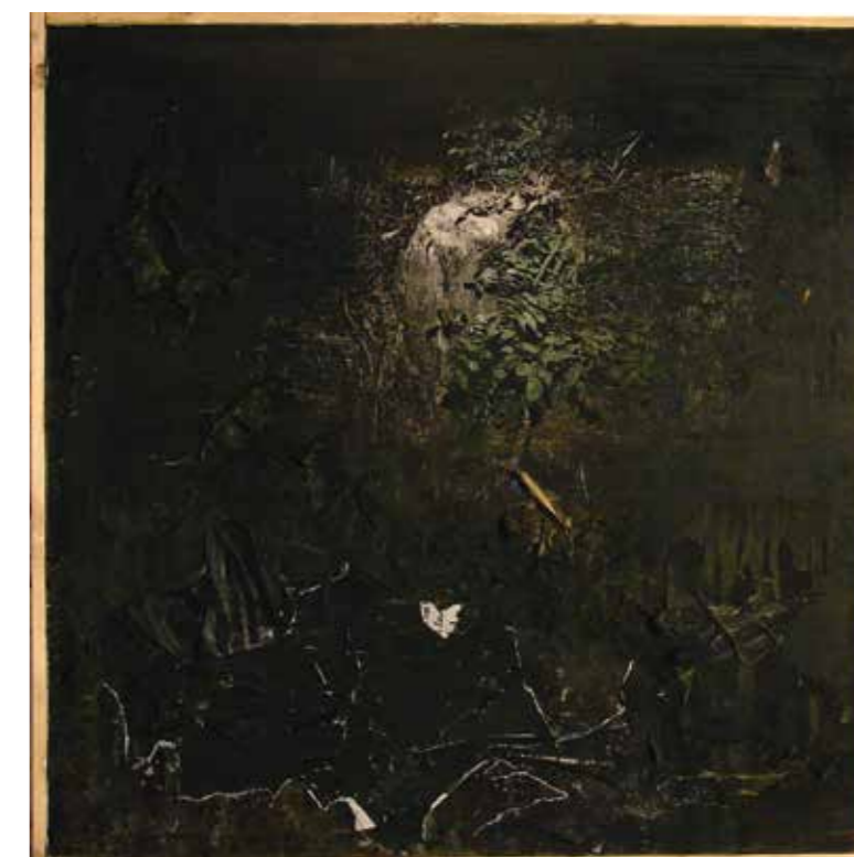
Dalla serie I From the series Buchi neri 2005-2012 Foto b'n colorata e virata a mano | Coloured b'n photograph, toned by hand cm. 60x60